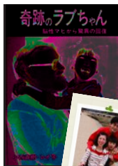
両親が対話形式で1988年出版。(彩古書房)

これまでの人生経験を生かし、幅広いジャンルでの講演をこなす。保育士や、看護師などの専門家向けのセミナーや、幼稚園や小学生の保護者向けの講座などで、体験談を交えつつ語る、独自の哲学に老若男女問わず、魅了されるファンはあとを絶たない。 言語障害を抱えつつも、おしゃべり好きの楽歩の姿に「生きる力をもらえる!」とご来場下さる方々に支えられ、少ない体力でもバワフルに、誰もが楽しい人生を送れる社会を目指し、精力的に活動中!!